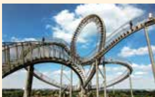
Tiger & Turtle

A: Der LaPaNo oder LaPaDu befindet sich rund um ein stillgelegtes Hüttenwerk in Duisburg-Meiderich. Er ist heute Teil der Route der Industriekultur im Ruhrgebiet und einer der Veranstaltungsorte für das eintägige Kulturfest ExtraSchicht, das auch als „Nacht der Industriekultur“ bekannt ist.